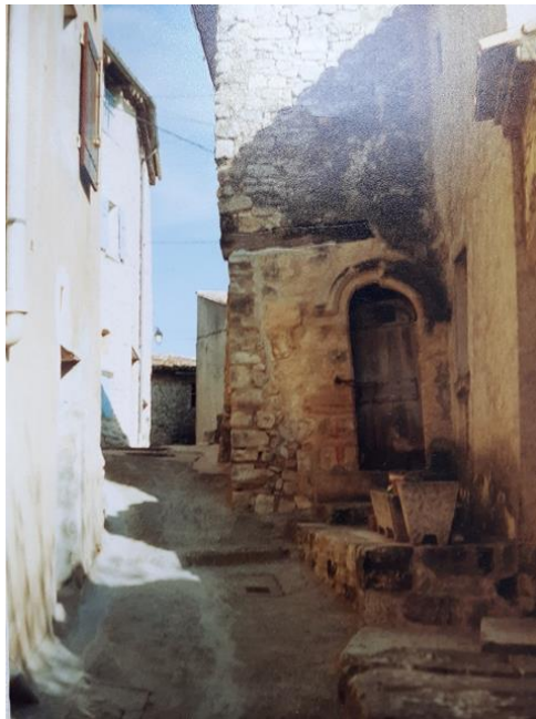
« Ombre à l'étroit » - © Alain LAVARENNE