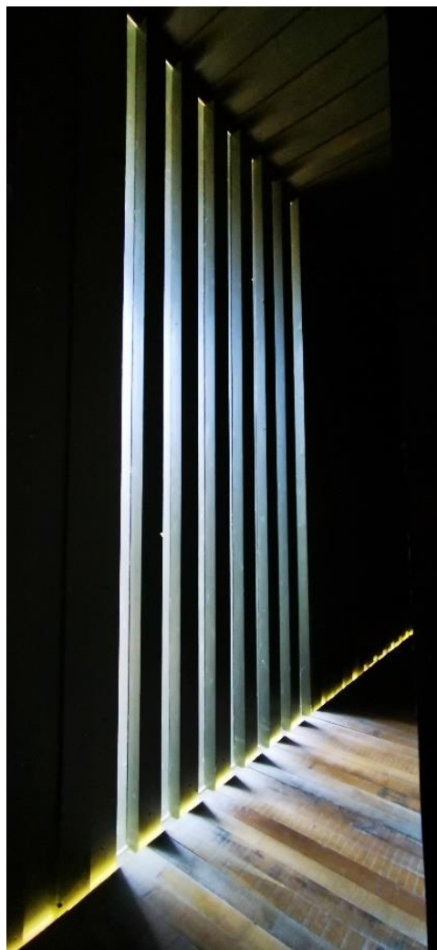
« Convergences » - © Gérard ISIDOR

Je souhaite à chacun de vous, Saint-Martinois de résidence ou de passage, de passer un très bel été sur la commune. Au plaisir de vous croiser sur nos événements.