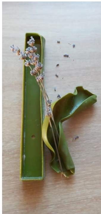
« Quand il fait chaud, j'me gondole ! »