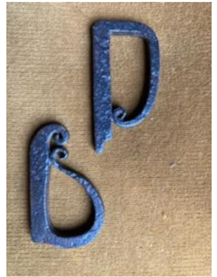
« L'ancêtre de nos allumettes » - © Gérard ISIDOR