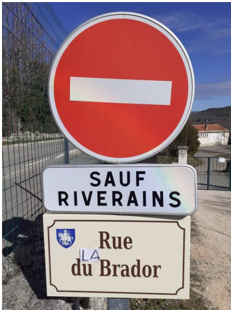
« Plaque détournée »

Trois clichés étaient candidats à cette nouvelle édition du concours « photo à la Une ». La photo gagnante est présentée à la Une, il s'agit d'une photo Gérard ISIDOR. Voici les autres clichés qui étaient en lice :